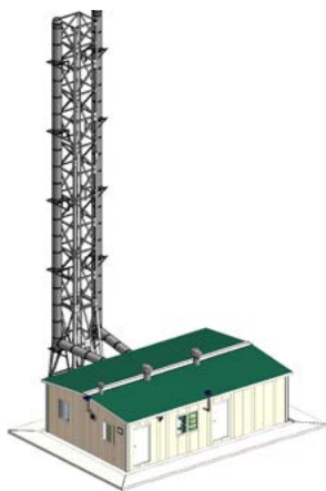
Газовая котельная, модель в Autodesk Revit.