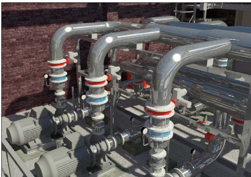
Повысительная насосная станция, детальная визуализация инженерного оборудования.